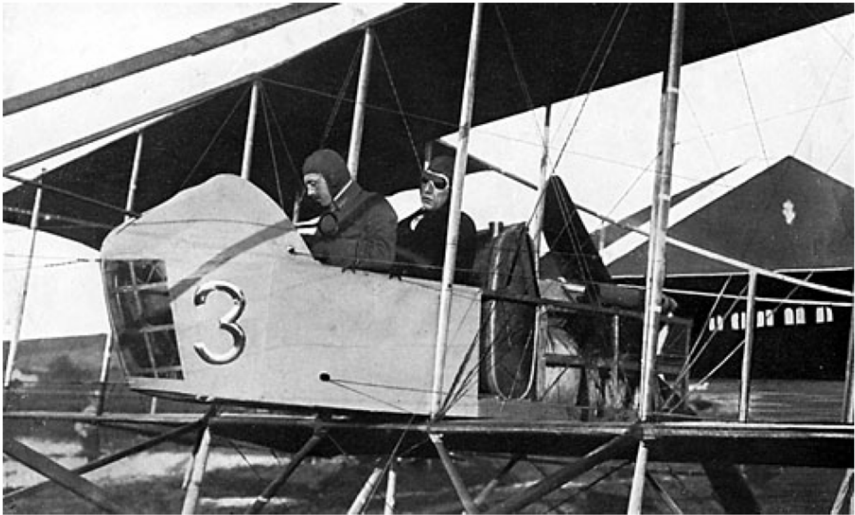
Illustrasjon: Første Norske Sivile sertifikatinnehaver Roald Amundsen gjør seg klar som elev for flygning på Kjeller 1913.